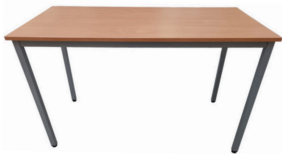
Table Table rectangulaire