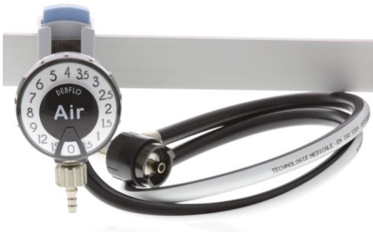
Débitmètre DEBFLO AIR - montage rail