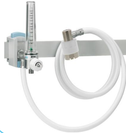
Rotamètres RTM3 Oxygène (O 2 ) - montage rail