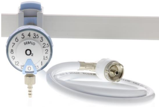
Débitmètre DEBFLO Oxygène (O 2 ) - montage rail