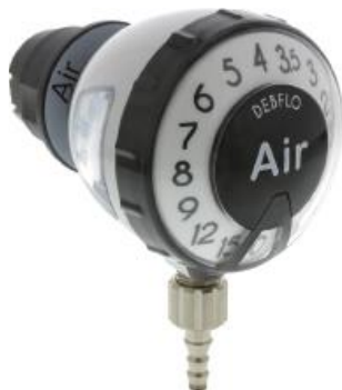
Débitmètre DEBFLO AIR - embout direct