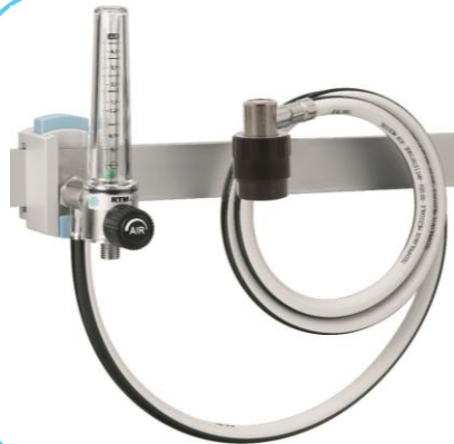
Rotamètre RTM3 AIR - montage rail