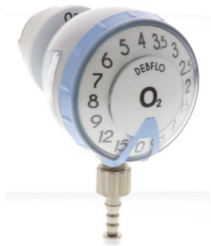
Débitmètre DEBFLO Oxygène (O 2 ) - embout direct